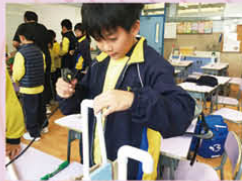
學習使用不同工具進行創作