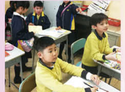
大哥哥大姐姐協助初小同學溫習默書範圍

高小學生協助校內初小學生提升自信心，建立對學校的歸屬感。高小學生亦能透過朋輩輔導提升關顧他人的意識，從幫助別人得到的成功經驗提升能力感及自信心。