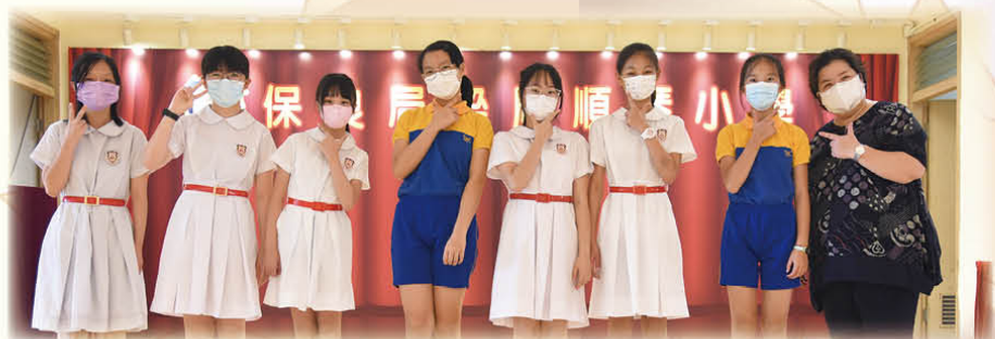
考獲保良局百周年李兆忠紀念中學的同學