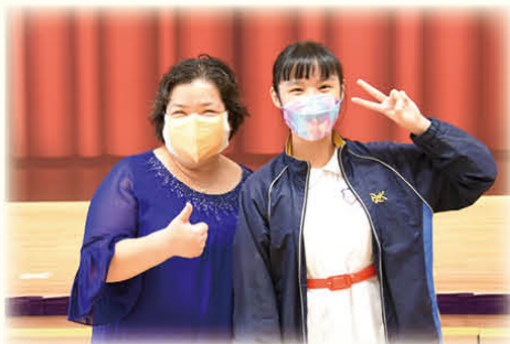
考獲聖保羅男女中學的同學