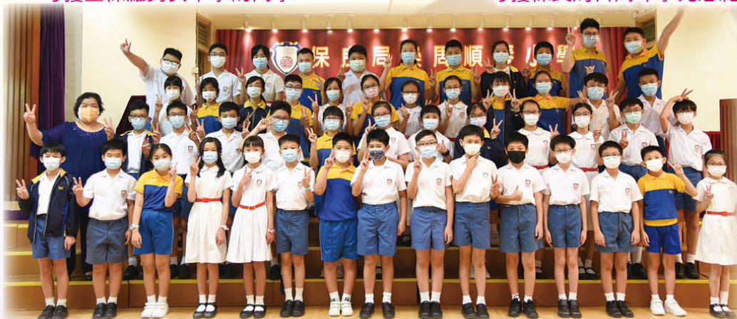
考獲保良局董玉娣中學的同學