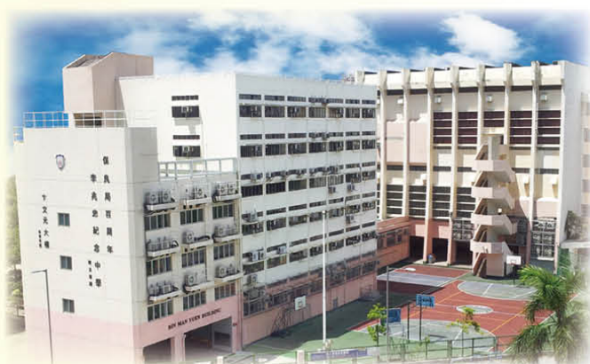
百周年李兆忠紀念中學

本校與保良局百周年李兆忠紀念中學及保良局董玉娣中學為聯繫中學。該兩間中學將保留百分之二十五的中一學位給予本校及其他屯門區的保良局所屬小學。因此，本校學生在升中派位時，如果未能於中央學位分配中獲派上述兩間中學，尚可透過聯繫學位，獲派入讀這兩間中學，所以本校的學生較其他學校的學生有更大的機會入讀這兩間屯門區的中學。